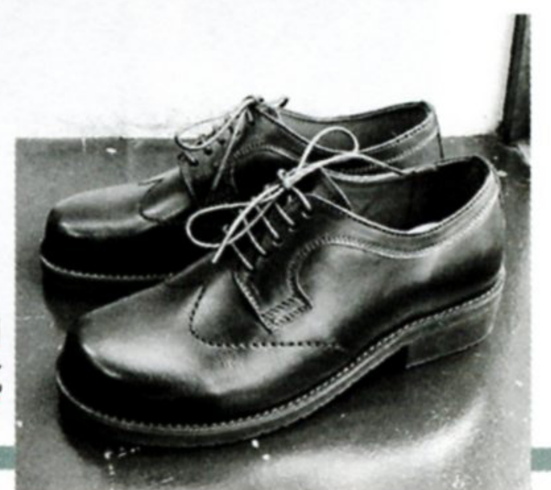
「防災・減災健康靴」のコンセプトでつくられた革靴