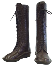
FRクロコ型押し ダークブラウン(非パンチ)