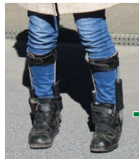
医療用装具を着用されている方の大変な苦勞が想像できます。

健康保険等が適用される医療用下肢装具は厚生労働省のマニュアルどおりに製作するので構造・形状等を変更することができません。 この不自由を解消するのが「フットレスキュー」歩行補助ブーツです。